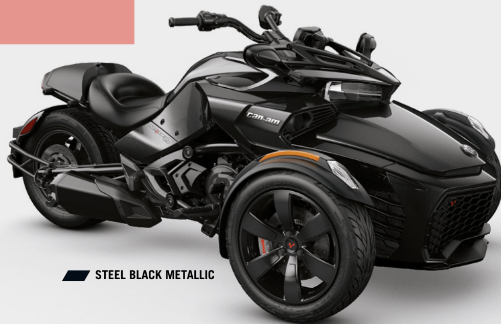
STEEL BLACK METALLIC